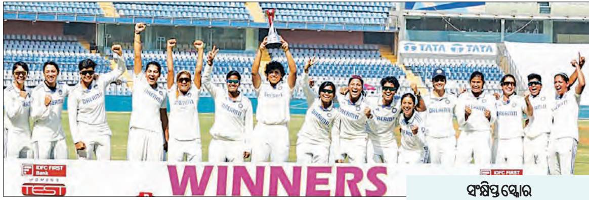
ଅଷ୍ଟ୍ରେଲିଆ ପ୍ରଥମ ପାଇଁ: ୨୧୯/୧୦। ଭାରତ ପ୍ରଥମ ପାଇଁ: ୪୦୬/୧୦। ଅଷ୍ଟ୍ରେଲିଆ ଦ୍ୱିତୀୟ ପାଇଁ: ୨୬୧/୧୦, ୧୦୫.୪

ଅଷ୍ଟ୍ରେଲିଆ ବିପକ୍ଷରେ ଭାରତର ପ୍ରଥମ ବିଜୟ ହୋଇଛି। ଗତ ୨୭ ବର୍ଷ ପରେ ଅଷ୍ଟ୍ରେଲିଆକୁ ପ୍ରଥମଥର ପାଇଁ ପରାସ୍ତ କରି ଭାରତୀୟ ଦଳ ଖୁସି ହୋଇଛି। ଶ୍ରୀଲଙ୍କା ପକ୍ଷରେ ଶ୍ରୀଲଙ୍କା ଦଳ ୩୦୯ ରନରେ ପାର୍ଥକ୍ୟ ହରାଇ ସର୍ବଶ୍ରେଷ୍ଠ ବିଜୟ ହାସଲ କରିଥିଲା।