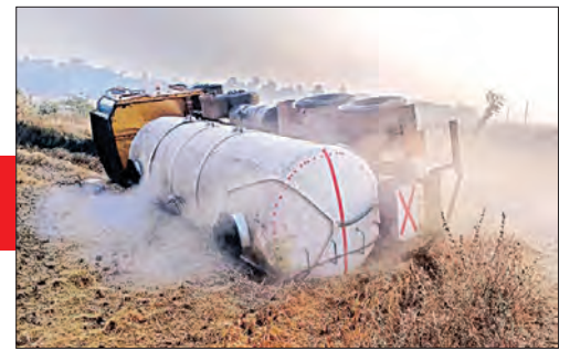
ଗ୍ୟାସ୍ ଲିକ୍ ବନ୍ଦକଲା ଅଗ୍ନିଶମ ବିଭାଗ

ବାହାନଗା, ୨୪/୧୨ (ସମ୍ପାଦକ): ବାଲେଶ୍ୱର ଏସିଡ୍ ଏକ ଟ୍ୟାଙ୍କରରେ ବୋହେଇ ଥିବା ହାଲଡ୍ରୋ କ୍ଲୋରାଇଡ୍ ଏସିଡ୍ ନିକ୍ତା ଜିଲ୍ଲା ବାହାନଗା ବ୍ଲକ୍ ଭଗତପୁର ଛିଡ଼ ହୋଇ ଭଗତପୁର ଛିଡ଼ ନୋଟନେଜ୍ ହୋଇଥିଲା।