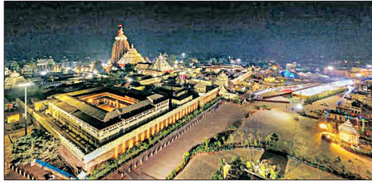
ସେବାୟତଙ୍କ ଉପସ୍ଥିତିରେ ଏ ସଂକ୍ରାନ୍ତରେ ବୃତ୍ତାନ୍ତ ହୋଇଛି। ଆସନ୍ତା ମାର୍ଗଶିର ପୂର୍ଣ୍ଣିମା (୨୬ ତାରିଖ)

■ ଭୁବନେଶ୍ୱର, ୨୪।୧୨ (ସମ୍ପାଦକ): ମାଘମାସ ଶୁକ୍ଳପକ୍ଷ ୬ମୀ ଅର୍ଥାତ୍ ଜାନୁଆରୀ ୧୭ ତାରିଖରେ ଲୋକାର୍ପଣ ହେବ ବହୁ ପ୍ରତୀକ୍ଷିତ ଶ୍ରୀମନ୍ଦିର ପରିକ୍ରମା ପ୍ରକଳ୍ପ। ପ୍ରଭୁ ଶ୍ରୀଜଗନ୍ନାଥଙ୍କ ଏହି ପବିତ୍ର କାର୍ଯ୍ୟକ୍ରମକୁ ଭବ୍ୟ ଭାବରେ ସମ୍ପାଦନ ପାଇଁ ପ୍ରସ୍ତୁତି ଆରମ୍ଭ କରିଛନ୍ତି ଶ୍ରୀମନ୍ଦିର ପ୍ରଶାସନ। ଏହି କାର୍ଯ୍ୟକ୍ରମରେ ଯୋଗଦେବା ନିମନ୍ତେ ଦେଶର ବିଭିନ୍ନ ଦେବପୀଠ ଓ ଧାର୍ମିକ ଗୁରୁମାନଙ୍କୁ ନିମନ୍ତଣ କରାଯିବ। ପୁରୀରେ ରାଜ୍ୟ ପ୍ରଶାସନର ବରିଷ୍ଠ ଅଧିକାରୀ, ଶ୍ରୀମନ୍ଦିର କର୍ତ୍ତୃପକ୍ଷ, ଛତିଶା ନିଯୋଗ ଓ