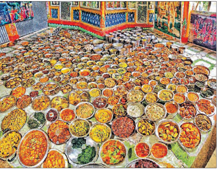
ମାର୍ଗଶୀର ଶୁକ୍ଳ ଦ୍ୱାଦଶୀ ତିଥିରେ ଶ୍ରୀଗୌରବିହାର ଆଶ୍ରମ (ମାତା ମଠ)ରେ ବ୍ୟଞ୍ଜନ ଦ୍ୱାଦଶୀ ରସୁବ ଅନୁଷ୍ଠିତ ହୋଇଯାଇଛି। ଶ୍ରୀରାଧାକୃଷ୍ଣଙ୍କ ନିକଟରେ ୮୫୧ ପ୍ରକାର ବ୍ୟଞ୍ଜନ ଲାଗି କରାଯାଇଛି

ଏହି ଗପକୁ ବିବାଦୀୟ କରାଯାଇଛି। କେବଳ ଗପ ସମୟରେ ଏକ ହୋଟେଲ ଘଟଣାକୁ ନେଇ ବିବାଦ ସୃଷ୍ଟି କରାଯାଇଛି। ଦୁଇ ଜଣ ଟ୍ରକ୍ ଡ୍ରାଇଭରଙ୍କ ବାହାର କେନ୍ଦ୍ରରେ 'ପାରମ୍ପୋରି' ଓ 'ଗୋମାଂସ' ଆଇଟମ୍‌କୁ ଆବିଷ୍କାର କରାଯାଇଥିଲା, ଯାହା ସମ୍ପର୍କରେ ସେ ନିଜ ଭିଡ଼ିଓରେ କହିଥିଲେ। ସେ ହିନ୍ଦୁ ହୋଇଥିବାରୁ ସେ ଗୋମାଂସ ନ ଖାଇ ସେହି ହୋଟେଲକୁ ପାରମ୍ପୋରି, କଡେଲା କରି ଓ ଅପମ୍ ଖାଇଥିଲେ, ଯାହାକି ସମ୍ପୂର୍ଣ୍ଣ ନିରାମିଷ। ଏହାକୁ ଖାଇସାରିବା ପରେ ତାଙ୍କ ଭିଡ଼ିଓରେ କେଉଁ ଖାଦ୍ୟ ପାଇଁ ତାଙ୍କୁ କେତେ ଟଙ୍କା ଦେବାକୁ ପଡ଼ିଛି, ତାହାର ମଧ୍ୟ ସୂଚନା ଦେଇଥିଲେ। ଅନେକ ସ୍ଥାନରେ ସେ ସ୍ଥାନୀୟ ଖାଦ୍ୟ ସମ୍ପର୍କରେ ସୂଚନା ଦେଇଥାନ୍ତି; ମାତ୍ର ଏହାକୁ ସେ ଖାଇ ନ ଥାନ୍ତି ବୋଲି ସ୍ପଷ୍ଟ କରିଛନ୍ତି।