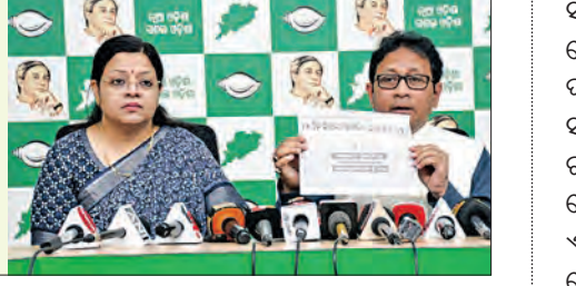
ତେଣୁ ଏହି ପ୍ରମୁଖ ରାସ୍ତାକୁ ଦୁରନ୍ତ ଶୋଚନୀୟ ଅବସ୍ଥାରୁ ଉଦ୍ଧାର ନକଲେ ଦଳ ତୀବ୍ର ପ୍ରତିବାଦ କରିବ ବୋଲି ଚେତାବନା ଦେଇଛି ବିଜେଡି। ଆଜି ଭୁବନେଶ୍ୱରରେ ସାମ୍ବାଦିକ

ନିଜ ଅଞ୍ଚଳର ଲୋକଙ୍କ ଦୁର୍ଦ୍ଦଶା ଦୂର ପାଇଁ ଯତ୍ନବାନ ଦୁହେଁ କେନ୍ଦ୍ରମନ୍ତ୍ରୀ ୬ ବର୍ଷ ହେଲା ସରୁନି କାମ; ଦୈନିକ ଗଡ଼ୁଛି ମୁଣ୍ଡ, ଉଜୁଡ଼ୁଛି ପରିବାର ସବୁକ ସୁରକ୍ଷା କମିଟିକୁ ଖାତିର କରୁନାହାନ୍ତି ଏନ୍‌ଏଚ୍‌-୫ର କର୍ତ୍ତୃପକ୍ଷ